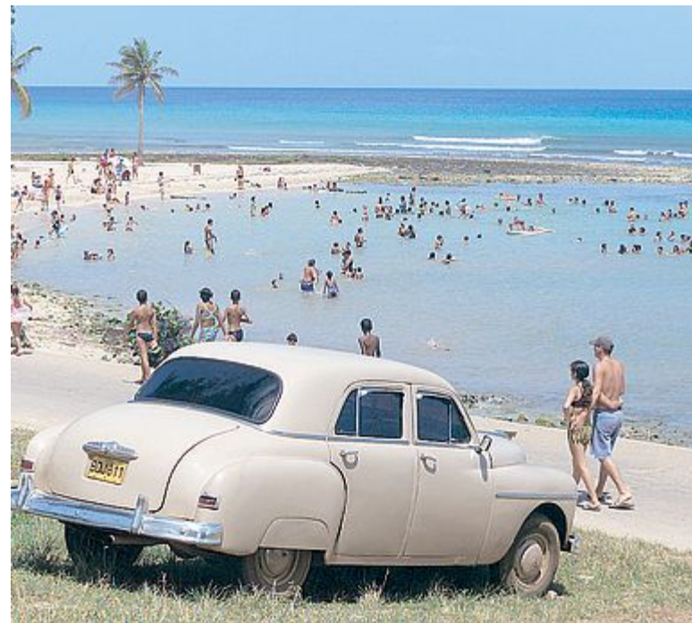
DISAVVENTURA Il trentenne è in stato di fermo a Cuba