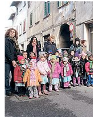
GIOIA I bambini della scuola d'infanzia di via Magenta

NON SONO mancati naturalmente alcuni interventi polemici da parte dei commercianti. In generale gli esercenti hanno chiesto maggiore attenzione per il centro storico; progetti per migliorare la percezione di sicurezza e iniziative per favorire l'integrazione con i cittadini extracomunitari che a Castelfranco, come in molti dei comuni limitrofi, risiedono per la maggior parte proprio nel centro storico. «Secondo noi — sottolinea Toti — la «scatola» c'è, perché negli ultimi quindici anni abbiamo investito pesantemente in infrastrutture a servizio del centro storico e delle zone limitrofe, ora però questo contenitore va in qualche modo riempito». «Castelfranco 2020» ha anche un sito (www.castelfranco2020) dove tutti possono lasciare il proprio contributo e seguire l'evolversi del progetto.