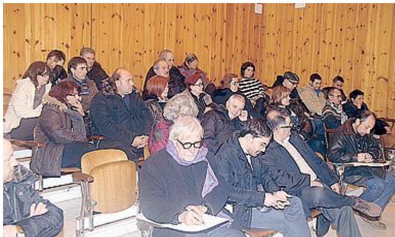
CONFRONTO I partecipanti all'incontro di ieri l'altro sera a Castelfranco

IL PRIMO PASSO sono due assemblee pubbliche con commercianti, cittadini e portatori di interesse. La seconda si svolgerà giovedì 27 dicembre a Orentano. La prima ha avuto luogo martedì nella sala consiliare di Castelfranco. Una sala consiliare che per l'occasione era gremita, a testimonianza del grande interesse che caratterizza questo argomento. Tanti soprattutto i commercianti, la maggior parte con la propria attività nel