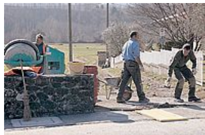
INTERVENTO Operai al lavoro per la messa in sicurezza di un tratto della via Francigena a Filattiera

buto di 42mila euro. «La Via Francigena — sottolinea Giovanni Longinotti, assessore alla cultura — è e sarà sempre uno dei must del nostro comune, fondatore dell'associazione della Via Francige-