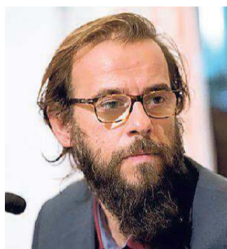
Il regista Andrea Segre

Stasera alle 21 un film in anteprima che arriva dalla Mostra del Cinema di Venezia: "L'ordine delle cose" di Andrea Segre . Nel film, Corrado è un alto funzionario del Ministero degli Interni italiano specializzato in missioni internazionali contro l'immigrazione irregolare. Il Governo italiano lo sceglie per affrontare una delle spine nel fianco delle frontiere europee: i viaggi illegali dalla Libia verso l'Italia. La missione di Corrado è molto complessa, la Libia post-Gheddafi è attraversata da profonde tensioni interne e mettere insieme la realtà libica con gli interessi italiani ed europei sembra impossibile. Corrado, insieme ai colleghi italiani e francesi, si muove tra stanze del potere, porti e centri di detenzione per mi-