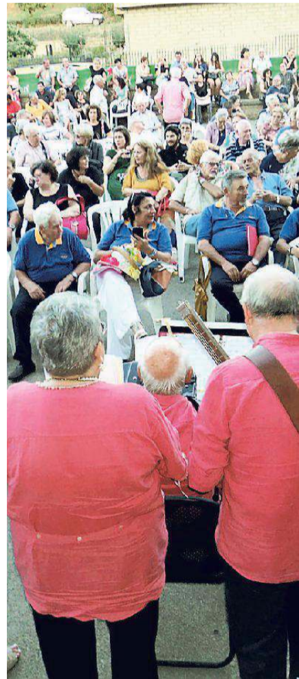
il gruppo folkloristico San Rocco di Marina di Grosseto

I ruderi dell'impianto termale romano sono visibili da sempre, ma la prima descrizione del sito archeologico risale al 1888, ad opera dell'allora Regio ispettore agli scavi e ai monumenti Alfonso Ademollo . Il noto studioso ne dette una breve descrizione, come ruderi emergenti da un impianto termale con una fonte semicircolare, un ingresso ad arco e alcuni vani sotterranei con una polla d'acqua. Una fotografia del 1915, conser-