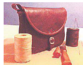
La pelletteria e i suoi strumenti

Il corso, come spiega lo stesso ideatore, garantisce una